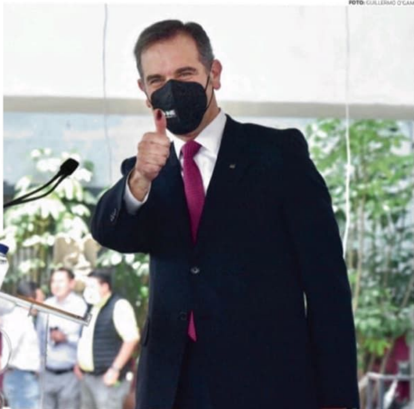
HISTÓRICO | El presidente del Instituto Nacional Electoral prevé que los resultados finales estén listos hoy antes de las 20:00 horas.

A l menos 91.9 por ciento de los ciudadanos que votaron ayer en la consulta de Revocación de Mandato, la primera en la historia de la democracia de México, se inclinaron por la opción: "Que siga en la Presidencia de la República" Andrés Manuel López Obrador.