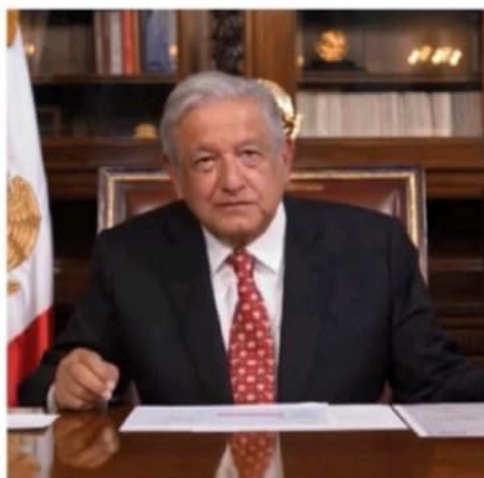
El presidente Andrés Manuel López Obrador subió un mensaje en redes.

La participación no llegó ni a la mitad del 40% del censo electoral necesario para que fuera vinculante