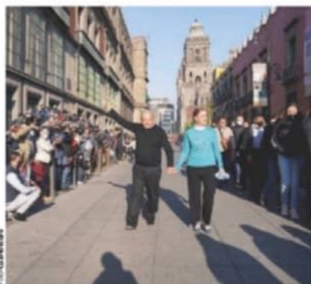
EL PRESIDENTE llegó con su esposa al centro de votación para emitir su sufragio, ayer por la mañana.

apuntó que la estimación del conteo rápido ubica el porcentaje entre 1.6 por ciento, que representan 270 mil 301, y 2.1 por ciento, equivalente a 354 mil 770 sufragios.