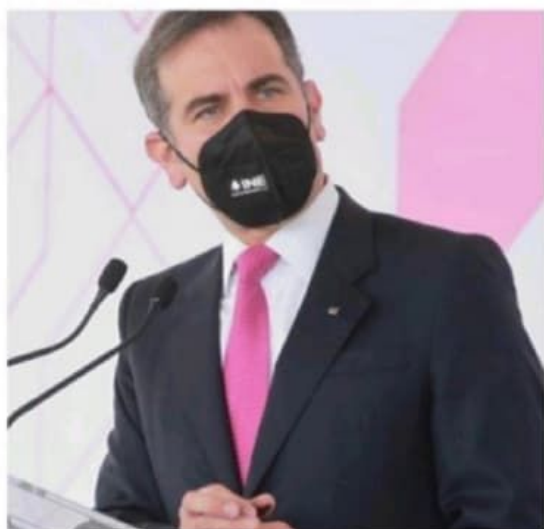
Lorenzo Córdova, titular del INE, al dar las cifras a las 21:00 horas.