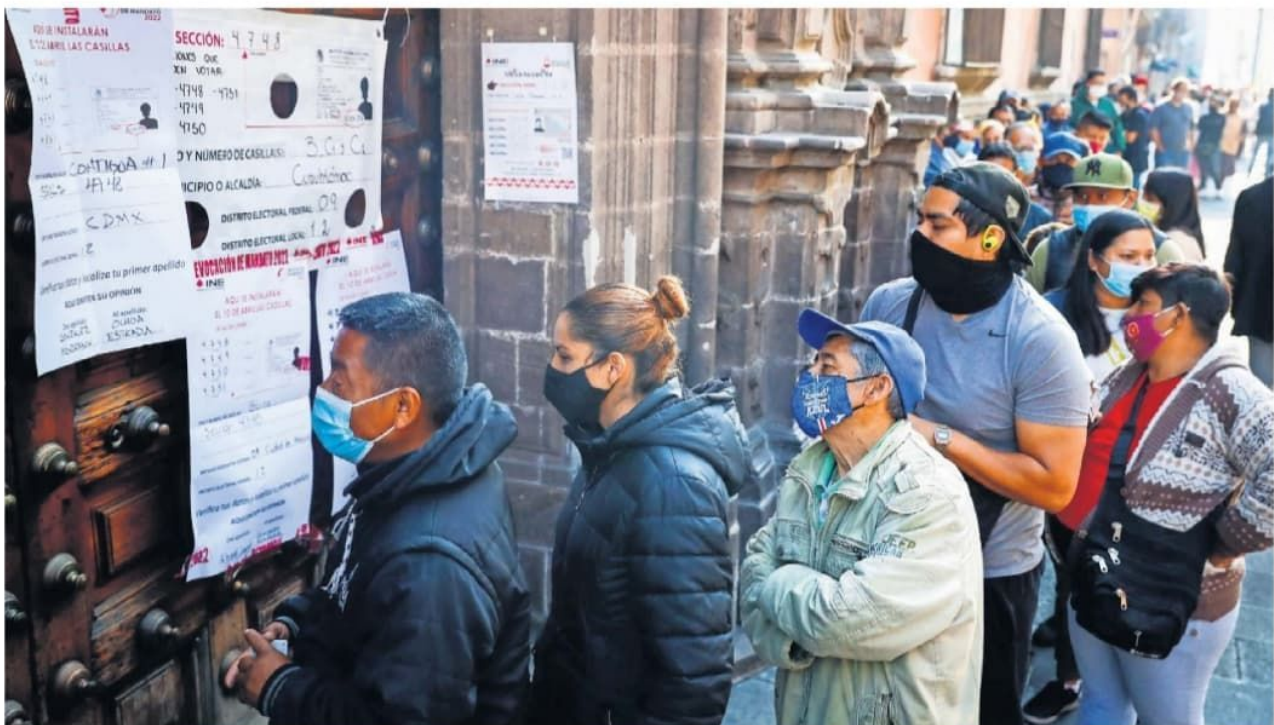
La Ciudad de México y el Estado de México fueron de las entidades que aportaron más votantes en la consulta de revocación, con casi 3 millones entre las dos.

Un aproximado de 16.7 millones de sufragios se emitieron ayer, con lo cual el ejercicio no podrá ser vinculante , ya que la Constitución señala que debe haber mínimo 40% de votantes